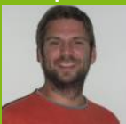
Guillaume BOULEUX guillaume.bouleux @univ-st-etienne.fr